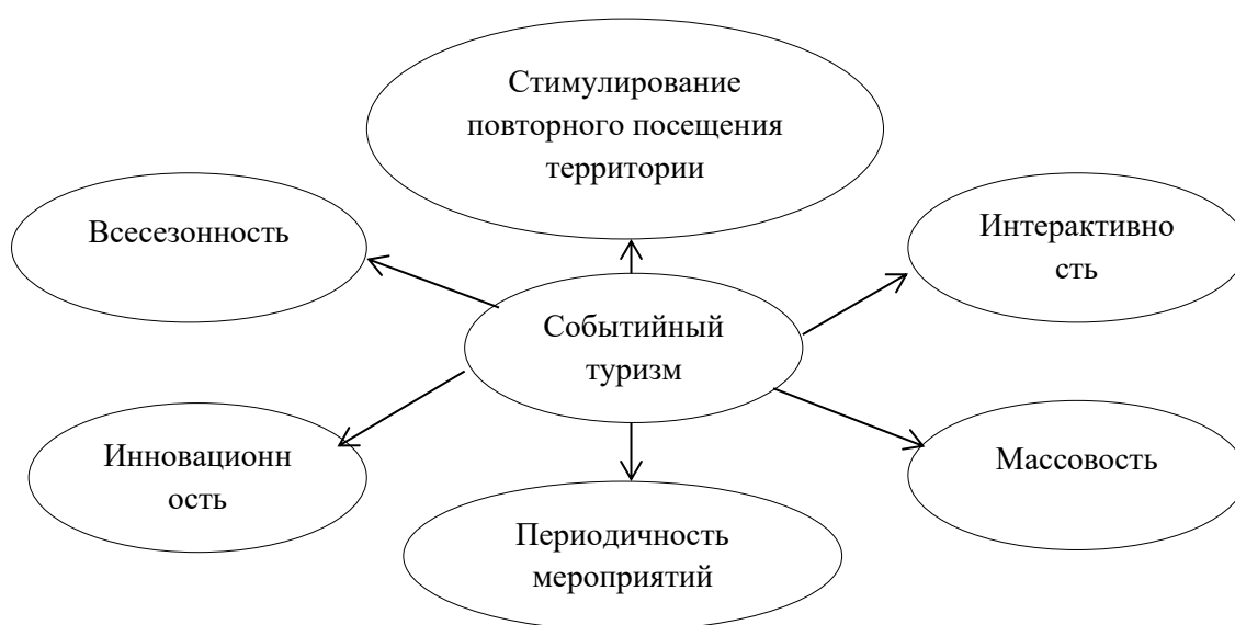
Рисунок 1. Отличительные характеристики событийного туризма

Событийный туризм обладает рядом характеристик, которые принципиально отличают его от других видов туризма, а также являются его значительными преимуществами. Изучение ряда литературных источников отечественных авторов позволило сформировать более полный перечень характерных и отличительных черт event- туризма, который представлен на рисунке 1.