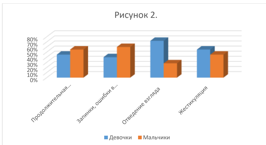
Рисунок 2. Невербальные признаки лжи

По результатам наблюдения можно сделать вывод, что характерными признаками лжи у мальчиков являются «Продолжительная пауза» и «Запинки, ошибки в речи», 55% и 60% соответственно. Для девочек же характерно использование «Жестикуляции» и «отведение взгляда», 72% и 55% соответственно.