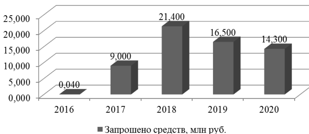
Рисунок 5. Динамика запрошенных сумм на реализацию проектов ТОС Хабаровского муниципального района в краевых конкурсах

В 2018 г. проведено 2 конкурса ТОС. На участие в конкурсах ТОСы муниципальных образований Хабаровского района направили 96 заявок (43 в первом конкурсе, 53 во втором). По итогам конкурсов победителями признаны 48 проектов (18 - в первом, 30 - во втором). На реализацию проектов выделено из краевого бюджета более 12 млн. рублей. Динамика запрошенных сумм на реализацию проектов ТОС Хабаровского муниципального района в краевых конкурсах за 4 года (Рис. 5).