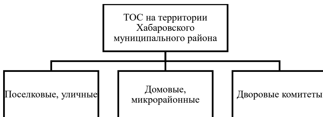
Рисунок 1. Структура ТОС на территории Хабаровского муниципального района

2. Многообразие уровней. В структуре ТОС на территории Хабаровского муниципального района поселковые, уличные, домовые, микрорайонные и дворовые комитеты (Рис. 1).