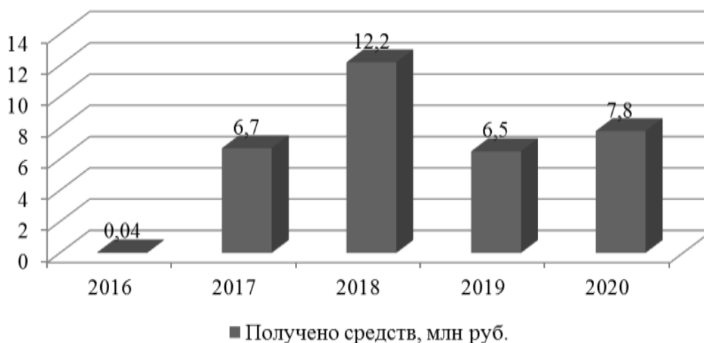
Рисунок 7. Динамика средств, полученных на реализацию проектов ТОС Хабаровского муниципального района в рамках краевых конкурсов

В 2019 г. в Хабаровском крае проведен 1 конкурс проектов ТОС, на который ТОСами Хабаровского района было направлено 96 проектов. Победителями признаны 20 проектов ТОС, на реализацию которых выделено из краевого бюджета 6,5 млн. рублей (Рис. 7).