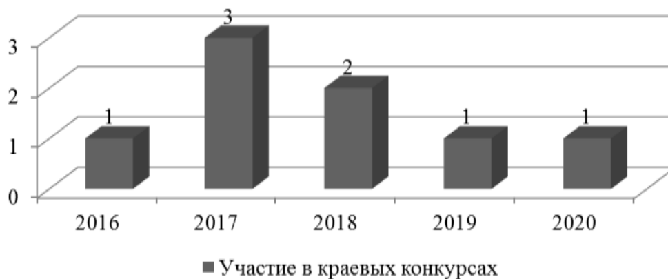
Рисунок 3. Динамика участия ТОС Хабаровского муниципального района в краевых конкурсах