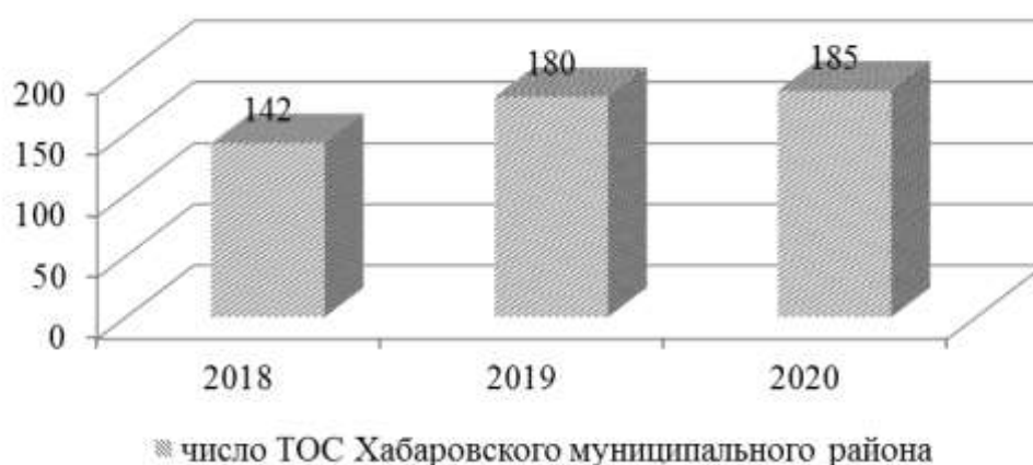
Рисунок 2. Динамика формирования ТОС на территории Хабаровского муниципального района

Как видим, число ТОС постоянно растет, но в 2020 году он замедлился (снижение до 102,78 % от показателя 126,76 % в 2019 году), что связано как с установлением ограничений связанных с пандемией КОВИД-19 и смещением вектора внимания населения на связанные с ней проблемы, а также с уже достаточно широким охватом инициативной части населения этой формой организации граждан в Хабаровском муниципальном районе.