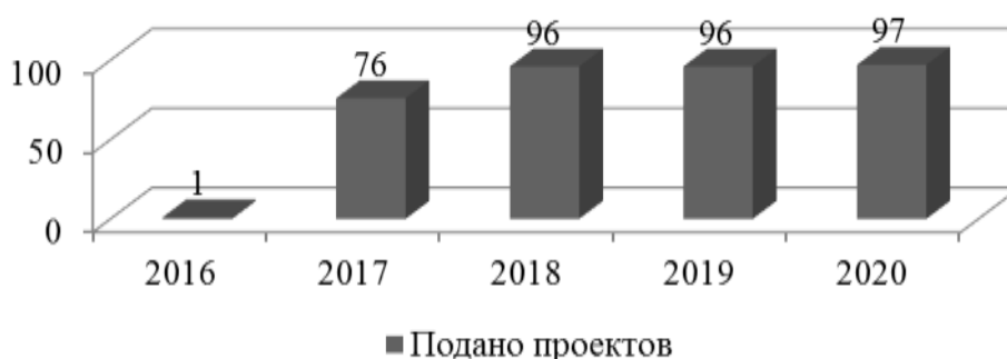
Рисунок 4. Динамика числа заявленных проектов ТОС Хабаровского муниципального района в краевых конкурсах

В 2017 г. проведено три конкурса проектов ТОС. На участие в конкурсах от Хабаровского района поступило 76 заявок. По результатам конкурсов победителями признаны 40 проектов (7 - в первом, 20 - во втором и 13 - в третьем конкурсах). На реализацию проектов выделено из краевого бюджета 6,7 млн. рублей. Динамика числа заявленных проектов ТОС Хабаровского муниципального района в краевых конкурсах (Рис. 4).