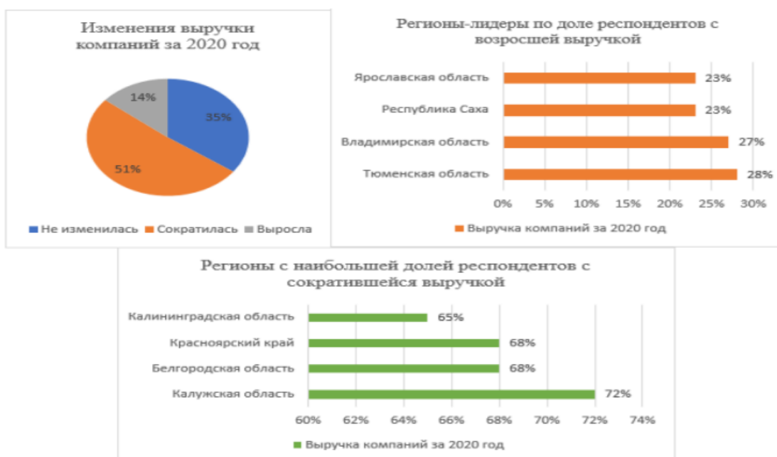
Рисунок 3 - Структура изменения выручки компаний за 2020 год

Все это приводит к резкому падению выручки МСП и сокращению штата работников в каждой третьей компании. Структура изменения выручки компаний за 2020 год представлена на рисунке 3.