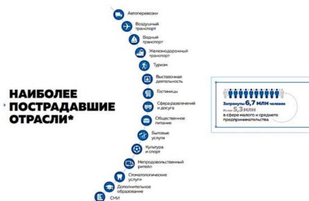
Рисунок 1 – Наиболее пострадавшие отрасли от пандемии в РФ.

Из этого следует, что наиболее пострадавшей категорией являются МСП в сфере предоставления услуг, поскольку безопасность жизнедеятельности как один из аспектов функционирования бизнеса подразумевает соблюдение мер защиты и исключения любого взаимодействия с клиентами. Так, например, индекс деловой активности малого и среднего бизнеса RSBI в 1-3 квартале 2020 г. составил минимальное значение за последние 5 лет: 48,6 п., что говорит о критическом положении сегмента малого и среднего бизнеса, вызванного вспышкой коронавирусной инфекции мирового масштаба [3].