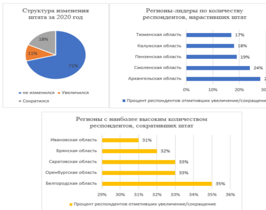
Рисунок 4 - Структура изменения штата компаний за 2020 год

Переход на удаленную работу позволяет представителям бизнеса не довести свое предприятие до банкротства, где до 25% предприятий смогут продолжить работу и сохранить рабочие места после пандемии [4].