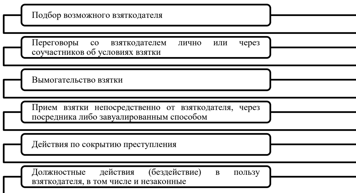
Рис. 2. Действия преступной деятельности взяточника