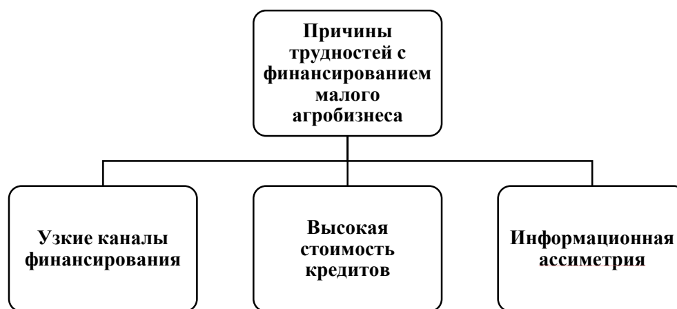
Рисунок 3 – Причины трудностей с финансированием малого агробизнеса

Проблемам, препятствующим развитию малого агробизнеса, посвящена работа [5]. Самое пристальное внимание авторы уделяют проблеме финансирования, подчеркивая: «Чтобы открыть ферму или запустить проект относительно уже работающей компании, помимо попытки преодолеть стену бюрократии, необходимы серьезные инвестиции, в частности, на покупку техники (тракторы, измельчители, холодильные камеры и пр.)» [5, с. 291]. Ключевые причины трудностей с финансированием, обусловленные дефектами финансовой системы, отражены на рисунке 3.