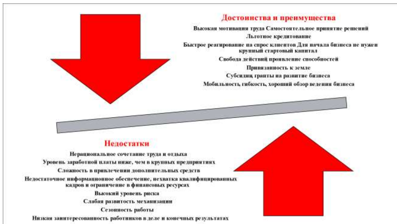
Рисунок 1 – Достоинства и недостатки малого агробизнеса

Также представляется необходимым уточнить, какие же рыночные субъекты относятся к малому агробизнесу. В соответствии со статьей 4 Федерального закона «О развитии малого и среднего предпринимательства в Российской Федерации» [1] установлены категории субъектов малого предпринимательства. В России к малым формам хозяйствования относятся: крестьянские (фермерские) хозяйства; личные подсобные хозяйства; малые (максимальное значение выручки составляет 800 млн руб., при численности до 100 чел.); микропредприятия (максимальное значение выручки – 120 млн руб. и до 15 чел. работающих). Уникальные характеристики малого агробизнеса очерчены в статье «Новые подходы к выделению критериев отнесения аграрных предприятий к малому предпринимательству» [4]. Для наглядности отразим авторский подход на рисунке 1.