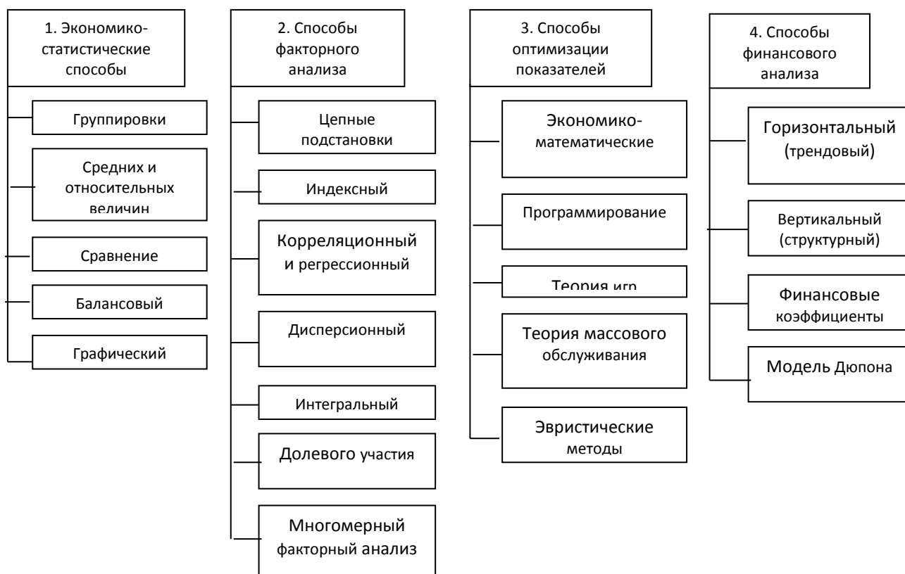
Рисунок 1 – Способы анализа финансового состояния организации

Многообразие способов анализа финансового состояния можно разделить на четыре блока (рисунок 1).