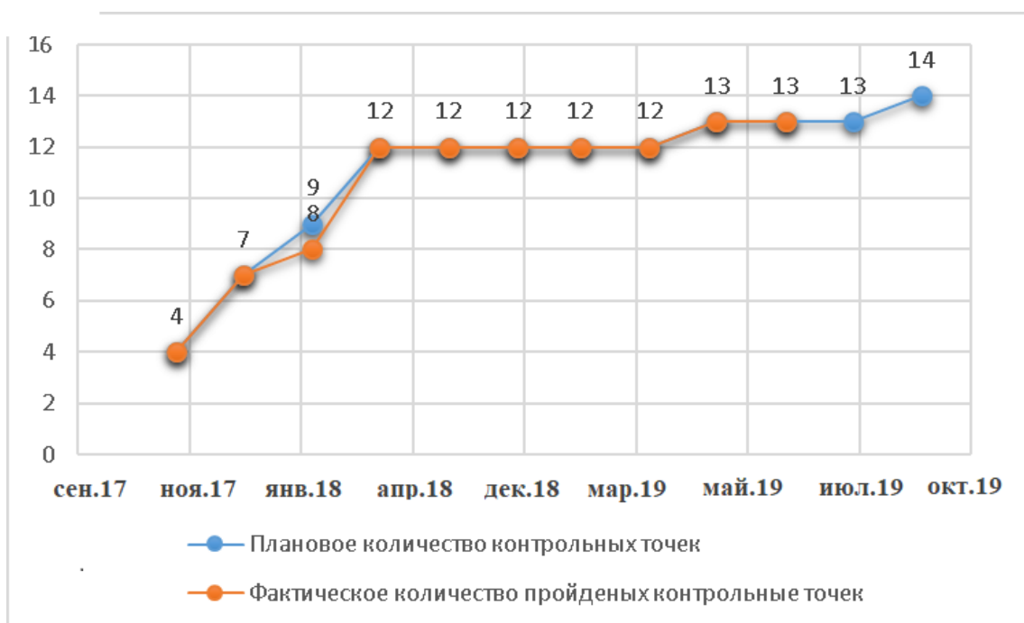
Рисунок. 1. Анализ управления временными параметрами образовательного проекта по датам ключевых вех

Таким образом, анализ управления временными параметрами проекта показал, что все работы проекта выполнены в срок или имеют отклонение в пределах нормы. Это свидетельствует об эффективном управлении временными параметрами проекта.